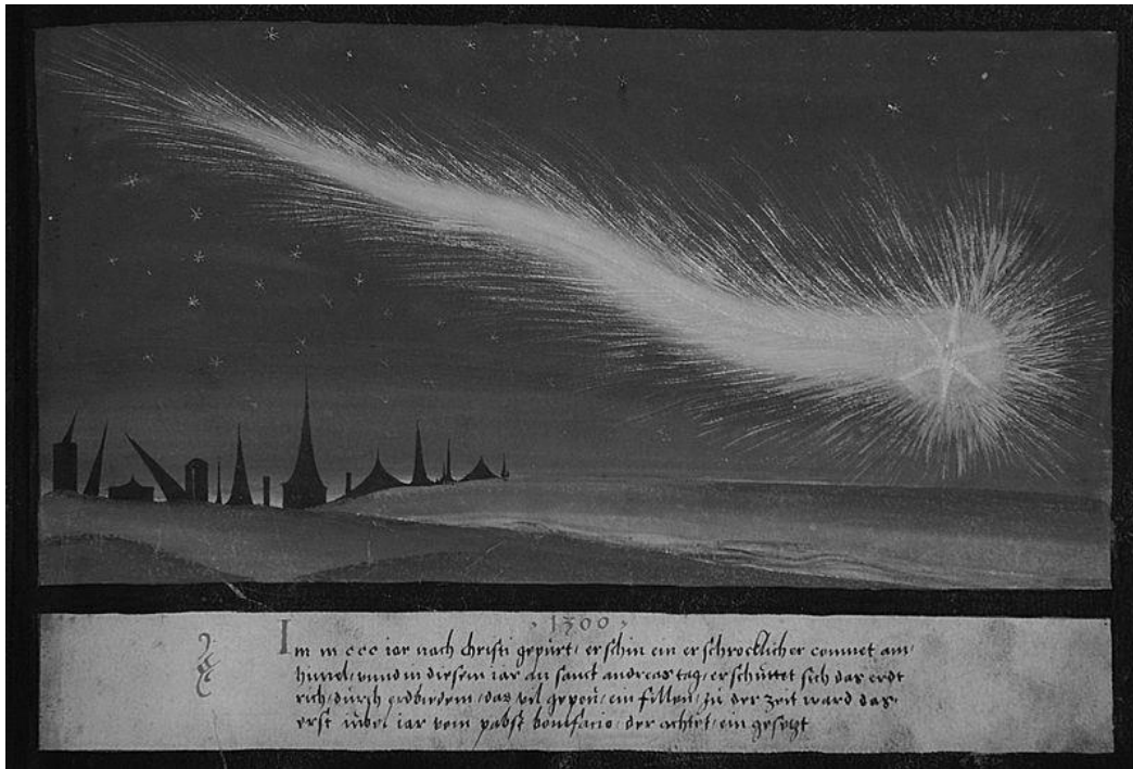
Autore sconosciuto. Cometa nel cielo del 1300. Augsburger Wunderzeichenbuch