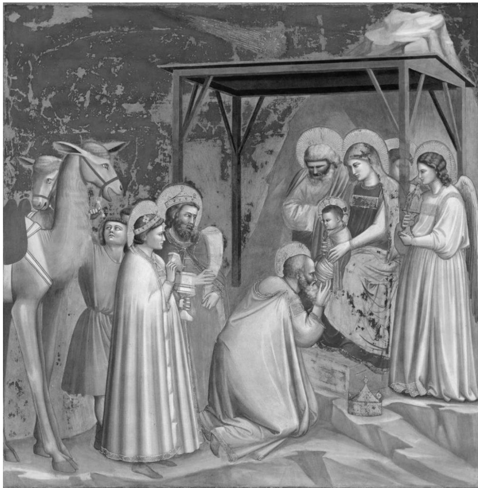
GIOTTO – Cometa della Natività

La forma della cometa può dare un'ulteriore natura al fenomeno che stiamo osservando. Per esempio, una Cometa gialla della natura di Venere ma dalla forma di una sciabola o di una spada, rievoca anche la natura di Marte. Sicuramente quelle più insidiose sono plumbee o che lasciano dietro di sé code corte o aloni scuri, perché queste rievocano la natura saturnina che è estremamente pericolosa per la vita dell'uomo e si focalizzeranno su specifici luoghi del mondo. Se la coda è molto lunga, la cometa "dissemina" i suoi effetti in tutto il mondo e non solo nel luogo in cui è osservato il fenomeno.